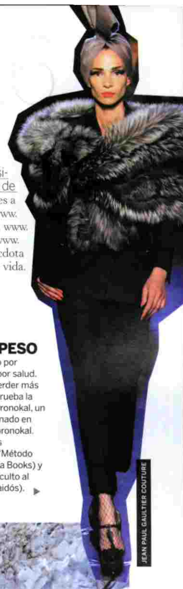
JEAN PAUL GAULTIER COUTURE

Y hazlo no solo por estética, sino por salud. Si necesitas perder más de diez kilos, prueba la exitosa dieta Pronokal, un método proteinado en sobres ( www.pronokal.com ). Lecturas adelgazantes: 'Método AIDA' (Ed. Salsa Books) y 'La Tiranía del culto al cuerpo' (Ed. Paidós). ▶