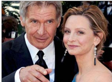
La diferencia de edad entre el actor Harrison Ford y la actriz Calista Flockhart es de 22 años.

Según ha comentado la responsable de comunicación de la agencia, Clara Bellido, el estudio tenía por objetivo "el comprobar la tendencia de los españoles en cuanto a la edad en las relaciones de pareja". Así, y con los resultados en la mano, ha quedado demostrado que "la edad no es un impedimento sino casi todo lo contrario". EPF